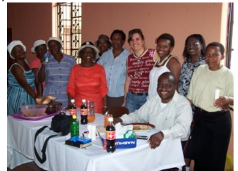
Workshop in Bekkersdal

Wir durften als Beobachter in einem Trainerteam dabei sein und die erste Workshopwoche miterleben. Zusammen mit zwei Trainerinnen aus Heilsarmee und Anglikanischer Kirche sahen wir uns plötzlich nicht wie erwartet 40 Pastoren, sondern ca. 30 Frauen und einem Mann zwischen 25 und 70 gegenüber. Viele der Teilnehmerinnen waren insofern direkt von AIDS betroffen, dass sie bereits Kinder oder Geschwister zuerst gepflegt und dann verloren hatten. Es war eine unglaublich bewegende Woche, in der viele Teilnehmerinnen zum ersten Mal einen Ort fanden, um über ihren Schmerz zu sprechen, um sachliche Informationen zu erhalten und lange angestaute Fragen zu stellen.