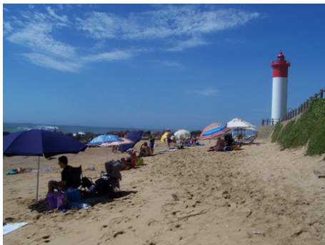
Umhlanga bei Durban