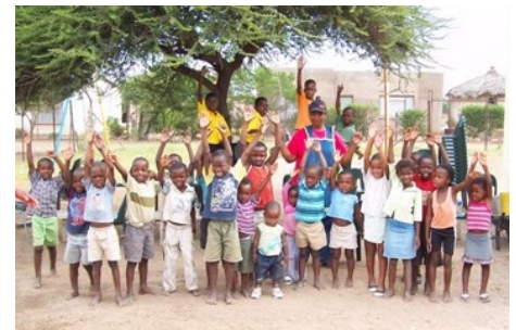
Thabo Drop In-Center

Nach einer fast fünfständigen Autofahrt, zuletzt über eine ungeteerte Schotterpiste, kamen wir in dem Projekt an. Es war beeindruckend zu sehen,